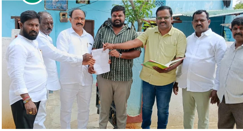
ఓటరు జాబితాలో పేర్లు తప్పగా ఉంటే ఏం చేయాలి

2026 జనవరి 1 నాటికి 18 సంవత్సరాలు నిండిన ప్రతి భారత పౌరుడు ఓటరుగా సమాధి చేసుకునేందుకు అర్హుడు. కొత్త ఓటరు సమయం కోసం ఫారం 6ను భర్తీ చేసి బీఎల్వోకు అందజేయవచ్చు. అలాగే ఆన్లైన్లో కూడా దరఖాస్తు చేసుకునే అవకాశం ఉంది. దరఖాస్తుతో పాటు వయస్సు, చిరునామా ప్రువీకరణ పత్రాల ప్రతులను జత చేయాలి ఉంటుంది.