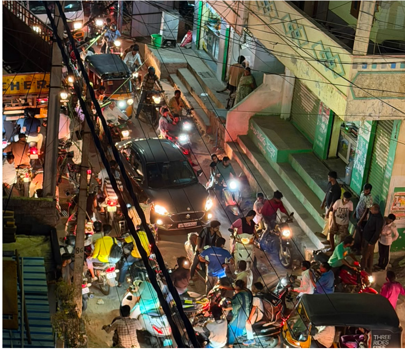
పక్కకు మళ్లించడం వల్ల ట్రాఫిక్ కు అంతరాయం కలుగుతోంది. ముఖ్యంగా ఉదయం కార్యాలయ సమయాల్లో, సాయంత్రం తిరుగు ప్రయాణ వేళల్లో భారీగా వాహనాలు నిలిచిపోతున్నాయి. తరచూ ప్రమాదాలు ట్రాఫిక్ రద్దీతో పాటు రహదారిపై ఉన్న ఈ సమస్య కారణంగా చిన్నపాటి ప్రమాదాలు తరచూ

హైదరాబాద్ కు అత్యంత సమీపంలో ఉన్న గుండ్లపోచంపల్లి డివిజన్ లో గత కొన్నేళ్లుగా అవార్ట్ మెంట్లు, గేట్స్ కమ్యూనిటీలు, నివాస కాలనీలు పెద్ద అత్యంత విస్తరణతో జనాభా గణనీయంగా పెరిగింది. దీంతో వాహనాల సంఖ్య కూడా విపరీతంగా పెరిగి రహదారిపై ఒత్తిడి అధికమైంది. అయితే పెరుగుతున్న అవసరాలకు అనుగుణంగా రోడ్ల విస్తరణ చేపట్టకపోవడంతో ట్రాఫిక్ సమస్య రోజూ రోజూకూ తీవ్రరూపం దాల్చుతోంది. రోడ్డు మధ్యలో మ్యాన్ హోల్ సమస్య ఈ మార్గంలో ఇప్పటికే రహదారి ఇరుకుగా ఉండగా, రోడ్డు మధ్యలో ఉన్న డ్రైనేజీ మ్యాన్ హోల్ దెబ్బతిని మరమ్మతులకు నోచుకోకపోవడం పరిస్థితిని మరింత క్లిష్టం చేస్తోంది. ప్రమాదం జరగకుండా ఉండేందుకు వాహనదారులు మ్యాన్ హోల్ వద్ద వేగం తగ్గించడం,