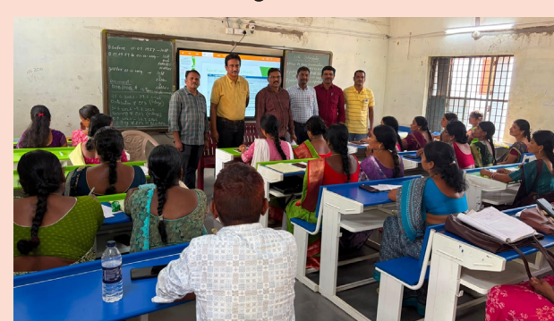
జయభేరి, తుర్కపల్లి, జూన్ 17 :