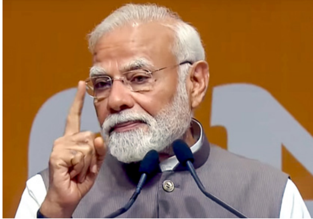
జయభేరి, న్యూఢిల్లీ :

పశ్చిమాసియాలో కొనసాగుతున్న యుద్ధ వాతావరణం, అంతర్జాతీయ మార్కెట్లలో ఒడుదొడుకుల నేపథ్యంలో ప్రధానమంత్రి నరేంద్ర మోడీ ఆర్థిక సలహా మండలితో శనివారం అత్యవసర భేటీ నిర్వహించారు. పశ్చిమాసియా (మిడిల్ ఈస్ట్) దేశాల మధ్య నెలకొన్న తీవ్ర ఉద్రిక్తతలు, యుద్ధ ముగింపుపై అనిశ్చితి ప్రపంచ దేశాలను వణికిస్తున్న వేళ.. భారత ప్రధాని నరేంద్ర మోడీ శనివారం రంగంలోకి దిగారు. ప్రధానమంత్రి ఆర్థిక సలహా మండలి సభ్యులతో ప్రధాని మోడీ శనివారం ఒక ఉన్నత స్థాయి కీలక సమావేశాన్ని నిర్వహించారు. గ్లోబల్ మార్కెట్లలో నెలకొన్న సంక్షోభం భారత ఆర్థిక వ్యవస్థపై ఎలాంటి ప్రభావం చూపుతుందనే అంశంపై ఈ భేటీలో సుదీర్ఘంగా సమీక్షించారు. ఈ భేటీలో పశ్చిమాసియా యుద్ధం వల్ల భారతదేశంతో పాటు ప్రపంచవ్యాప్తంగా తలెత్తుతున్న పరిణామాలపై ఆర్థిక నిపుణులు తమ అంచనాలను ప్రధానికి వివరించారు. ముఖ్యంగా అంతర్జాతీయంగా