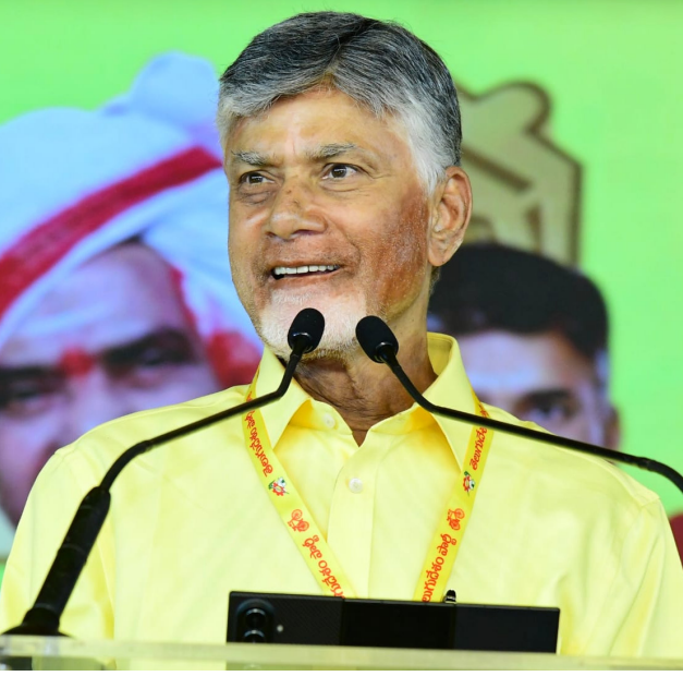
జయభేరి, విజయవాడ జూన్ 4 :

ఏపీ రాజకీయాల్లో సంచలన విజయాన్ని నమోదు చేసి, కూటమి ప్రభుత్వం అధికారంలోకి రావడానికి పునాది పడిన రోజును గుర్తుచేసుకుంటూ ముఖ్యమంత్రి చంద్రబాబు నోచేట్ మీడియా వేదికగా ఒక భావోద్వేగ పోస్ట్ పెట్టారు. 2024 జూన్ 4వ తేదీ (ఎన్నికల ఫలితాలు వచ్చిన రోజు) ఆంధ్రప్రదేశ్ చరిత్రలో ఎప్పటికీ చిరస్థాయిగా నిలిచిపోతుందని ఆయన పేర్కొన్నారు. రాష్ట్రంలో గత ప్రభుత్వంలో ఐదేళ్లుగా సాగిన విధ్వంసకాండకు పూర్తిగా స్పష్ట పలికి.. రాష్ట్రాన్ని మళ్లీ వికాసం వైపు ప్రగతి వైపు నడిపించాలని ఆంధ్రప్రదేశ్ ప్రజలు ఎంతో స్పష్టమైన తీరునిచ్చిన రోజు ఇదని చంద్రబాబు గుర్తుచేసుకున్నారు. ఈ సందర్భంగా ఆయన ప్రజలకు ఒక కీలక సందేశాన్ని ఇచ్చారు. ప్రజలు తమకు అప్పగించింది కేవలం 'అధికారాన్ని' కాదని.. కోలుకోలేని స్థితికి చేరిన రాష్ట్రాన్ని మళ్లీ పునర్నిర్మించే ఒక 'గొప్ప బాధ్యతను' తమ భుజాలపై పెట్టారని ఆయన వ్యాఖ్యానించారు. కూటమి ప్రభుత్వం ప్రతిక్షణం ప్రజల ఆశలు, ఆకాంక్షలను నెరవేర్చేందుకే పనిచేస్తుందని సీఎం స్పష్టం చేశారు. సంక్షేమం, అభివృద్ధి, సుపరిపాలన