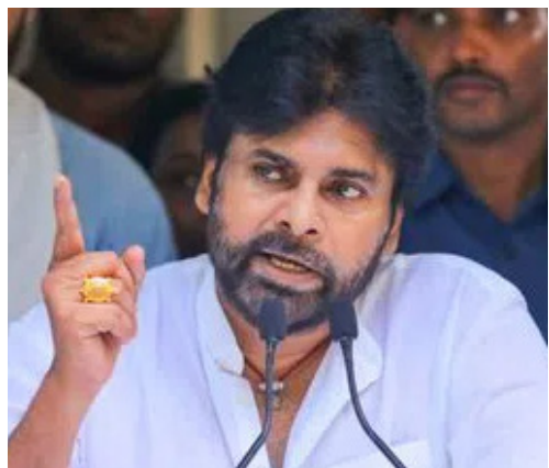
జయభేరి, విజయవాడ :

తెలంగాణ గురించి జనసేన ఎందుకు మాట్లాడుతుందని అడుగుతున్నారు. జనసేన పార్టీ పెట్టినా హైదరాబాద్ నడిబొడ్డన.. ఇది తెలంగాణపై కొత్తగా తెచ్చుకున్న ప్రేమ కాదని ఉపముఖ్యమంత్రి పవన్ కళ్యాణ్ అన్నారు. నేను తెలంగాణ నలుమూలలా తిరిగాను. తెలంగాణ బాగుండాలని అనుకునేవాణ్ణి.. ఇప్పుడు నన్ను విమర్శించేవారు ఆదిలాబాద్ లాంటి సక్కల్ ప్రభావిత ప్రాంతాల్లో తిరగలేదు. నేను తెలంగాణకు వ్యతిరేకం కాదు.. విభజన జరిగిన తీరుకు వ్యతిరేకమని అన్నారు. తెలంగాణ ప్రజలకు, నాయకులకు ఏపీ ప్రజలపై విద్వేషం లేదు. హైదరాబాద్లో ఎలా అడుగుపెడతారని కొందరు అడుగుతున్నారు. మీ అయ్య జాగీరా తెలంగాణ. మీరెవరు నన్ను బెదిరింపడానికి..? బెదిరించేవారికి ఒకటే చెబుతున్నా.. నా ఇంటి అడ్డం చెప్పడానికే ఇక్కడ ప్రెస్ మీట్ పెట్టానని అన్నారు.