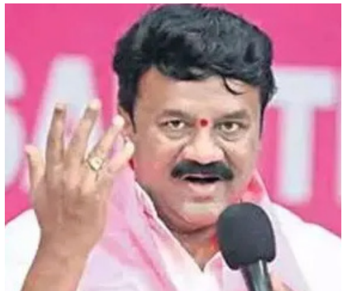
జయభేరి, హైదరాబాద్ :

కాంగ్రెస్ పార్టీని ప్రజలు పండబెట్టి తొక్కే రోజులు దగ్గరలోనే..