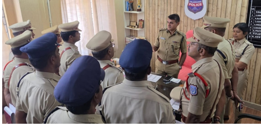
అమలు చేయాలని అధికారులకు సూచించారు. ప్రజల ఫిర్యాదులకు తక్షణ స్పందన ఇవ్వాలని, నేర కేసుల దర్యాప్తును నాణ్యంగా నిర్వహించాలని ఆదేశించారు.

ప్యూచర్ సిటీ పోలీస్ కమిషనరేట్ సీపీ తరూట్ జోషి షాద్ నగర్ టౌన్ పోలీస్ స్టేషన్ ను మంగళవారం సందర్శించి పోలీస్ స్టేషన్ పనితీరుపై సమగ్ర సమీక్ష నిర్వహించారు. ఈ సందర్భంగా కమిషనర్ పలు అంశాలను పరిశీలించి శాంతిభద్రతల పరిరక్షణ, నేరాల దర్యాప్తు, నివారణ చర్యలు, ప్రజా ఫిర్యాదుల పరిష్కారం తదితర అంశాలపై పోలీస్ స్టేషన్ పని తీరును సమీక్షించారు. స్టేషన్ రికార్డులు, పెండింగ్ దర్యాప్తులు, వినతుల పరిష్కారం, నేర గణాంకాలు, శాఖాపరమైన కార్యక్రమాల అమలును పరిశీలించారు. ప్రజలకు అనుకూలంగా, పారదర్శకంగా, బాధ్యతాయుతంగా వ్యతిరేకమైన పోలీసింగ్ ను