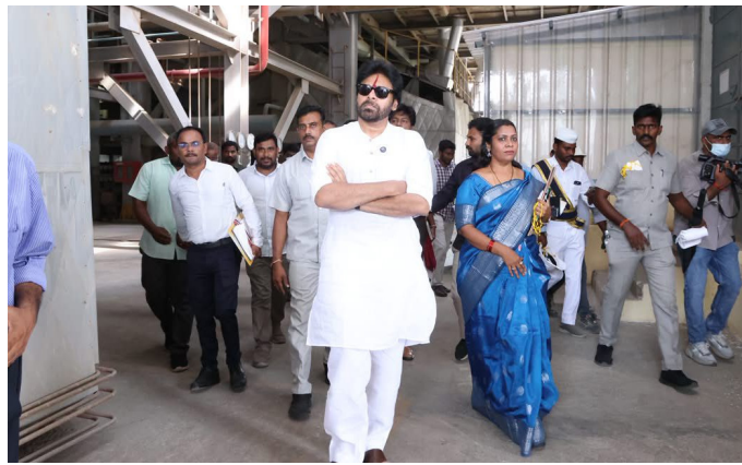
జయభేరి, పల్నాడు జిల్లా:

ఆంధ్రప్రదేశ్ ఉప ముఖ్యమంత్రి పవన్ కళ్యాణ్ పర్యావరణ పరిరక్షణ, స్వచ్ఛత దిశగా సరికొత్త అడుగులు వేస్తున్నారు. శనివారం పల్నాడు జిల్లా కొండపిడులోని జిందాల్ వేస్ట్ టూ ఎన్ టీ ఫ్లాట్ ను సందర్శించిన ఆయన, చెత్త నుంచి సంపదను సృష్టించడమే లక్ష్యంగా ప్రభుత్వ భవిష్యత్తు కార్యాచరణను ప్రకటించారు. ముఖ్యంగా రాజ్ కోయ్ గోదావరి పుష్కరాలను కాలుష్య రహితంగా నిర్వహించడంతో పాటు, రాష్ట్రాన్ని డంపింగ్ యార్డ్ రహిత ఏపీగా తీర్చిదిద్దడమే తన ఆశయమని ఆయన స్పష్టం చేశారు. "చెత్త అనేది వ్యర్థం కాదు... అది విద్యుత్తును ఇచ్చే ఇంధన ప్రత్యామ్నాయం" అని ...మిగతాది 2 లో