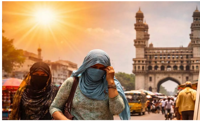
జయభేరి, హైదరాబాద్, మే 30:

తెలంగాణ రాష్ట్రంలో ఎండ తీవ్రత పీకే స్నేహకు చేరింది. పది జిల్లాల్లో ఉష్ణోగ్రతలు రికార్డు స్థాయిలో నమోదవుతుండగా.. పడదెబ్బ కారణంగా శుక్రవారం ఒక్కరోజే వివిధ జిల్లాల్లో తొమ్మిది మంది ప్రాణాలు కోల్పోయారు. ఆసిఫాబాద్ జిల్లా దహిగాంలో అత్యధికంగా 46.3 డిగ్రీల సెల్సియస్ ఉష్ణోగ్రత నమోదైంది. రాష్ట్రంలోని 46 మండలాలలో తీవ్రమైన వడగాలులు వీస్తున్నాయి. మరో రెండు రోజుల పాటు ఈ వడగాలుల తీవ్రత కొనసాగుతుందని.. అయితే ఆదివారం నుంచి రాష్ట్రంలోని ...మిగతాది 2 లో