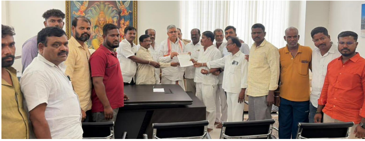
జయభేరి, యాదగిరిగుట్ట, మే 19 :