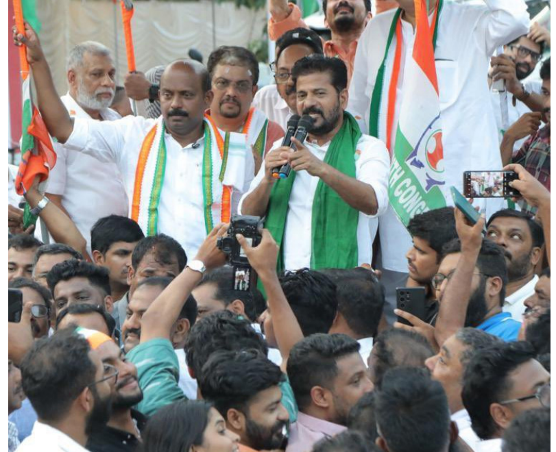
జయభేరి, హైదరాబాద్ :