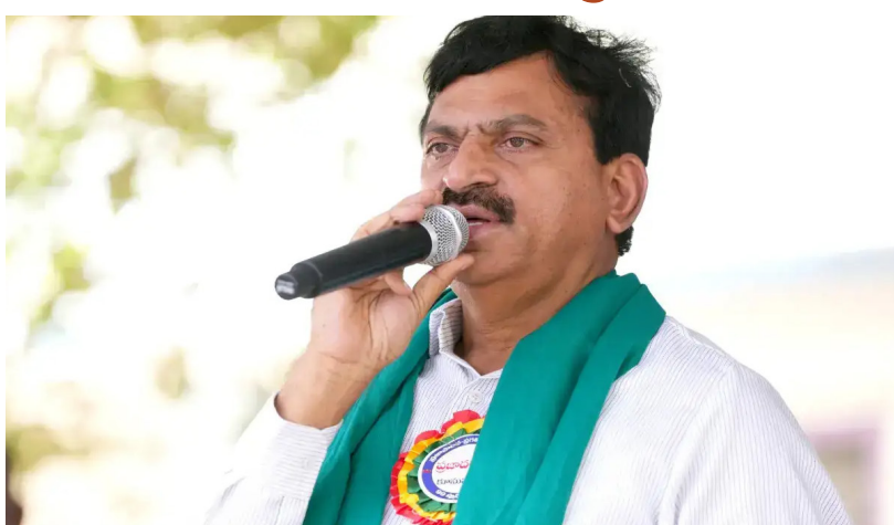
జయభేరి, ఖమ్మం :

తెలంగాణ ప్రభుత్వం అమలు చేస్తున్న ఇందిరమ్మ ఇళ్ల పథకం రెండో విడతపై మంత్రి పొంగులేటి