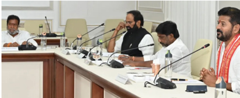
జయభేరి, హైదరాబాద్ :

తెలంగాణ రాష్ట్రంలో కాంగ్రెస్ ప్రభుత్వం రెండవ సంవత్సరం చివరి దశలోకి అడుగుపెడుతున్న తరుణంలో నేడు (మే 4) మధ్యాహ్నం 3 గంటలకు సచివాలయంలో కేబినెట్ సమావేశం జరగనుంది. ముఖ్యమంత్రి రేవంత్ రెడ్డి అధ్యక్షతన జరిగే ఈ భేటీలో రాష్ట్ర ఆర్థిక వనరులు, నీటి పారుదల ప్రాజెక్టులు, ఉద్యోగుల సమస్యలు ప్రధాన అజెండాగా