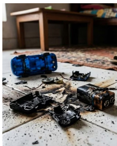
జయభేరి, మెడక్ :

వేసవి సెలవులో సరదాగా ఆడుకుంటున్న కొను కున్న ఒక చిన్న బ్యాటరీ ఆ బాలుడి జీవితంలో తీరని విషాదాన్ని సృష్టించింది. బొమ్మలో వేసిన బ్యాటరీ అకస్మాత్తుగా పేలడంతో నాలుగో తరగతి చదువుతున్న ఓ బాలుడు తన వీడలను చేతి మూడు వేళ్లను కోల్పోయాడు. మెడక్ జిల్లా శివంపేట మండల కేంద్రంలో ఆదివారం చోటుచేసుకున్న ఈ హృదయవిదారక