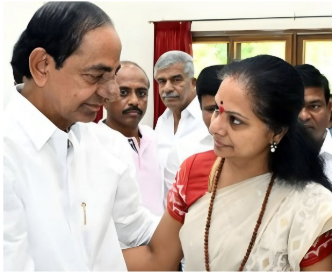
జయభేరి, హైదరాబాద్, ఏప్రిల్ 25 :

టీఆర్ఎస్ పేరుతో పార్టీని ప్రారంభించిన కల్పకంట్ల కవిత తన రాజకీయ ప్రస్థానంలో ఒక సాహసోపేతమైన మలుపు తీసుకున్నారు. కేవలం ఒక కొత్త పార్టీని స్థాపించడమే కాకుండా, తన తండ్రి కేసీఆర్ నిర్మించిన రాజకీయ పునాదులపైనే ఎదిగేలా ఆమె రెడీ చేసుకున్న రూల్ మాస్ తెలంగాణ రాజకీయాల్లో కొత్త మార్పులు తీసుకు రానుంది. ఎన్నికల్లో ఓడిపోయిన తర్వాత బీఆర్ఎస్ పార్టీని టీఆర్ఎస్ గా మార్చే ఆలోచన ఉందని కేటీఆర్ చెప్పారు. దీనికి కారణం ప్రజలు బీఆర్ఎస్ పేరు మార్చుకోవాలన్న ఆలోచన ఉందని యింటింటికీ ఫిలవుతున్నారని కూడా చెప్పారు. ...మిగతాది 2 లో