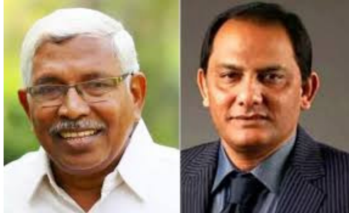
జయభేరి, హైదరాబాద్, ఏప్రిల్ 25 :