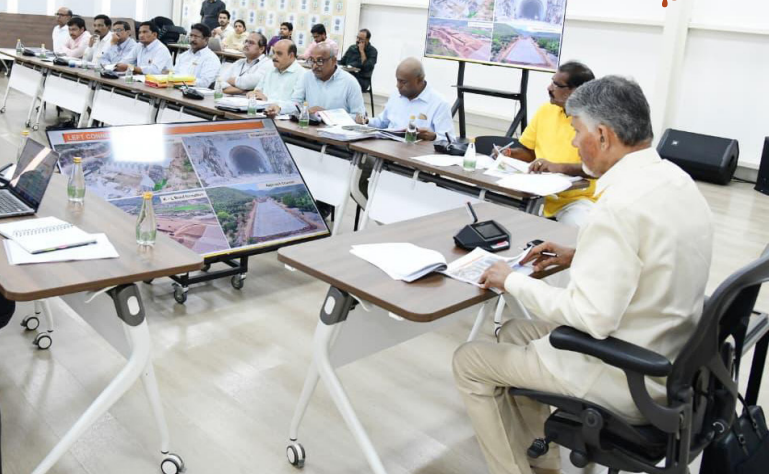
జయభేరి, అనంతపురం, ఏప్రిల్ 15 :