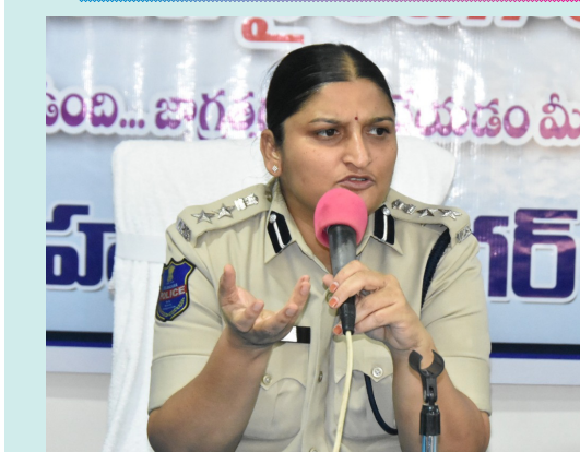
జయభేరి, మహబూబ్ నగర్ :

ప్రజా పాలన ప్రగతి ప్రణాళిక 99 రోజుల కార్యక్రమంలో భాగంగా, మహబూబ్ నగర్ జిల్లా పోలీసుల ఆధ్వర్యంలో "అరెస్ట్ అలైన్" రోడ్డు భద్రత అవగాహన కార్యక్రమం ప్రభుత్వ పాఠశాల, పోలీస్ లైన్ లో నిర్వహించారు. ఈ సందర్భంగా జిల్లా ఎస్సీ డి.జానికి, విద్యార్థులతో కలిసి మానవహారం (Human Chain) ఏర్పాటు చేసి, రోడ్డు భద్రతపై అవగాహన కల్పించారు. జిల్లా ఎస్సీ మాట్లాడుతూ, రోడ్డు ప్రమాదాలు ప్రధానంగా నిర్లక్ష్యం, అధిక వేగం మరియు ట్రాఫిక్ నియమాలు పాటించకపోవడం వల్ల జరుగుతున్నాయని తెలిపారు. ప్రతి ఒక్కరూ హెల్మెట్ ధరించడం, సీట్ బెల్ట్ వినియోగించడం, ట్రాఫిక్ సిబందనలు కచ్చితంగా పాటించడం ద్వారా ప్రమాదాలను నివారించవచ్చని సూచించారు. అలాగే చిన్న వయస్సు నుండి విద్యార్థులకు రోడ్డు భద్రతపై అవగాహన కల్పించడం ఎంతో అవసరమని, వారు బాధ్యత గల పౌరులుగా ఉండాలని పేర్కొన్నారు. విద్యార్థులు ఇక్కడ తెలుసుకున్న రోడ్డు భద్రత నియమాలు తమ ఇళ్లలో తల్లిదండ్రులకు కూడా తెలియజేసి, వారితో చర్చించి, తూచా తప్పకుండా పాటిచేలా ప్రోత్సహించాలని జిల్లా ఎస్సీ సూచించారు.