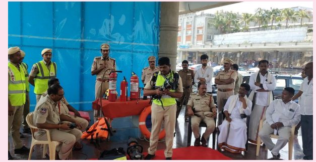
జయభేరి, హయత్ నగర్ :