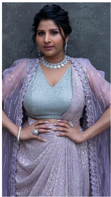
జయభేరి, హైదరాబాద్, ఏప్రిల్ 15 :

• డబ్బులు ఇచ్చినవారు తిరిగి ఇవ్వాలని కోరితే దౌర్జన్యానికి దిగుతున్నారు