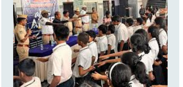
జయభేరి, హైదరాబాద్ :