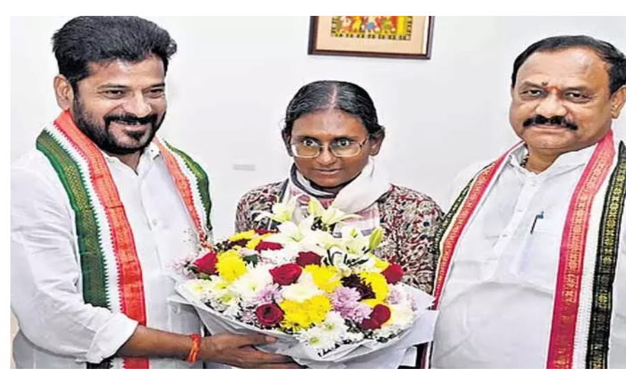
జయభేరి, హైదరాబాద్, ఏప్రిల్ 15 :

రైతులను ముక్కాన్ని అసరాగా చేసుకుని అక్రమ విత్తన వ్యాపారులు మళ్లీ పడగ విప్పుతున్నారు. ప్రభుత్వం కఠినంగా నిషేధించిన హెచ్.టి.బీ.టి. లేదా 'గైసీల్' పత్తి విత్తనాలు మార్కెట్ లో గుట్టుచప్పుడు కాకుండా అమ్ము