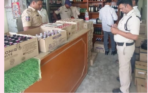
జయభేరి, దంతాలపల్లి, ఏప్రిల్ 15 :

మండల కేంద్రంలోని కౌశిక వైస్ పై సర్దుంపుల ఫోరం ఆధ్వర్యంలో వైస్ ముందు నిరసన మరియు పత్రికలో పచ్చిన కథనంపై వెంటనే స్పందించిన తొర్రూర్ ఎక్స్ ప్రెస్ సీబి ఆశోక్ బుద్ధవారం కౌశిక వైస్ పై తనిఖీ నిర్వహించారు అదనపు రేట్లు అమ్మడాన్ని, పలు అంశాలపై తనిఖీ నిర్వహించి టెక్నికల్ కేసు నమోదు చేసినట్లుగా తెలియజేశారు. మరోకసారి ఎలాంటి ఫిర్యాదులు రాకుండా చూసుకోవాలని లేని పక్షంలో కఠినమైన చర్యలు ఉంటాయని వైస్ యాజమాన్యాన్ని హెచ్చరించారు. సంబంధిత మండల బ్యూరో డిప్యూటీ అక్రమంగా బెల్ట్ పావులకు తరలించిన, అధిక రేట్లకు మద్దతు విక్రయించిన, మద్యం ప్రయోజనం ఇబ్బందులు కలగజేసిన ఎక్స్ ప్రెస్ శాఖ ఆధ్వర్యంలో కఠినమైన కేసులు నమోదు చేస్తామని హెచ్చరించారు. ఈ కార్యక్రమంలో పోలీసు అధికారులు సిబ్బంది పాల్గొన్నారు.