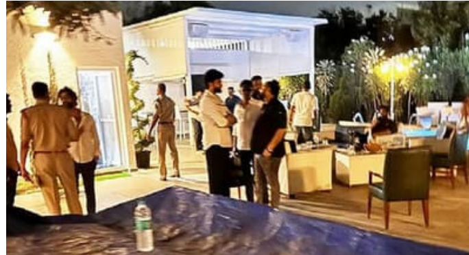
జయభేరి, హైదరాబాద్, ఏప్రిల్ 13 :