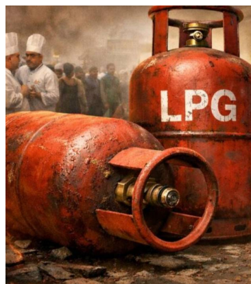
చదానికి రంగారెడ్డి, మేడ్చల్ జిల్లాల్లో పైపుల ద్వారా సహజ వాయువు పంపిణీని ప్రభుత్వం వేగవంతం చేసింది. గోదావరి బేసిన్ నుంచి

పశ్చిమాసియా యుద్ధం కారణంగా ఎల్పీజీ సరఫరాలో తర్రెళ్ల ఇబ్బందులను అధిగమించ