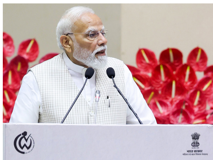
జయభేరి, న్యూఢిల్లీ :

దేశ రాజధాని వెదికగా ప్రధానమంత్రి నరేంద్ర మోడీ కీలక ప్రకటన చేశారు. త్వరలో అతిపెద్ద చారిత్రాత్మక నిర్ణయాన్ని తీసుకోబోతున్నామని అన్నారు. 21వ శతాబ్దంలో తీసుకున్న నిర్ణయాల్లో ఒకటిగా చరిత్రలో నిలిచిపోతుందని పేర్కొన్నారు. ఇది దేశాభివృద్ధికి మరింత ఊపునిస్తుందని, మహిళల భాగస్వామ్యాన్ని గణనీయంగా పెంచుతుందని ఆయన తేల్చి చెప్పారు. ఆర్థిక, సామాజిక, రాజకీయ రంగాలను మలుపు తిప్పుతుందని అన్నారు. ఢిల్లీ విజ్ఞాన భవన్ లో నిర్వహించిన నారీ శక్తి వందన్ సమ్మేళన్ లో మోడీ మాట్లాడారు. మహిళా రిజర్వేషన్ బిల్లును 21వ శతాబ్దపు