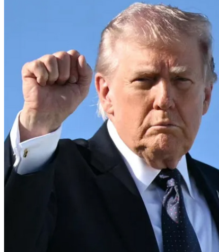
జయభేరి, న్యూఢిల్లీ, ఏప్రిల్ 13 :

హోర్నుజ్ జలసంధిలో సోమవారం సాయంత్రం దిగ్బంధం మొదలైందని ట్రంప్ ప్రకటించారు. ఇరాన్ ప్రపంచ దేశాలను భూక్ మెయిల్ చేయకుండా, దోపిడీ చేయకుండా ఉండేందుకే ఈ దిగ్బంధం చేపట్టామని తెలిపారు. "ఇరాన్ నౌకాదళాన్ని నాశనం చేశాం. 158 ఇరాన్ నౌకలు సముద్రం అడుగుకు చేర్చాం. మాకు పెద్దగా ముమ్మీమీ కలిగించవన్న భావనతో ఇరాన్ కు చెందిన కొన్ని చిన్న పాస్ అటాక్ నౌకలను మాత్రం వదిలిపెట్టాం. ఇప్పుడు ఆ నౌకలెవైనా మా దిగ్బంధం వైపు వస్తే వెంటనే పేల్చేస్తాం" అని ట్రంప్ పేర్కొన్నారు. యుద్ధం మొదలైనప్పటి నుంచి అత్యధికంగా శనివారం 34 నౌకలు హోర్నుజ్ చాటాయని చెప్పారు. శాంతి ఒప్పందం కుదుర్చుకోవాలని ఇరాన్ ఆరాటపడుతోందని, పాకిస్తాన్ లో చర్యల దీనిపై పలుమార్లు సంప్రదింపులు జరిపిందని తెలిపారు. పర్షియన్ గల్ఫ్ లో చిక్కుకున్న 15 భారత నౌకలు హోర్నుజ్ జలసంధి మూసివేతకు ముందు 25 భారత నౌకలు పర్షియన్ గల్ఫ్ ప్రాంతంలో ఉండిపోయాయని అధికార వర్గాలు వెల్లడించాయి. క్రమంగా అందులో 10 నౌకలు హోర్నుజ్ ను దాటి రాగా, మిగతావి అక్కడే చిక్కుకుపోయాయని తెలిపాయి. అందులో ఒక డెడ్లీంగ్ నౌక, మరో రసాయనాల నౌకతోపాటు ఎల్ఎస్జీ, ఎల్పీజీ, చమురు ట్యాంకర్లు, కంట్రైన్ షిప్లు ఉన్నాయని వెల్లడించాయి. ఇప్పుడు అమెరికా కూడా హోర్నుజ్ దిగ్బంధానికి దిగడంతో.. ఆ నౌకలు ఎప్పుడు తిరిగి వచ్చేది స్పష్టత లేకుండా పోయిందని పేర్కొన్నారు.