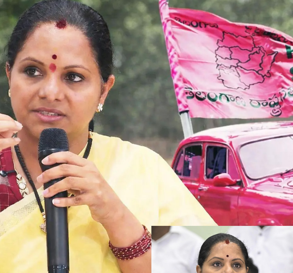
జయభేరి, హైదరాబాద్, ఏప్రిల్ 6 :