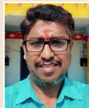
-కన్నప, స్థానికుడు, యాదగిరిగుట్ట

కోతుల బెడదపై మున్సిపల్ పాలక మండలి దృష్టి సారించాలి, వాటిని నియంత్రించి ప్రజలు స్వేచ్ఛగా రోడ్లపై తిరిగేలా చేయాలని కోరుతున్నాం.