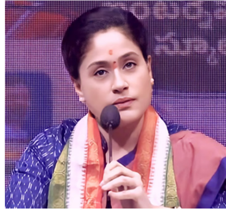
జయభేరి, హైదరాబాద్, ఏప్రిల్ 4 :

కాంగ్రెస్ పార్టీ నాయకురాలు.. ఎమ్మెల్యే విజయశాంతి.. ఉర్రప్ రాములమ్మ.. ఇటీవల మండలి సమావేశాల్లో చివరి రోజు పెద్ద ఎత్తున మాట్లాడిన విషయం తెలిసిందే. తెలంగాణ ఉద్యమంలో పాలు పంచుకున్న వారికి న్యాయం చేయాలని.. లేకపోతే.. కాంగ్రెస్ ప్రభుత్వం చరిత్ర పీనంగా మిగిలిపోతుందని ఆమె సంచలన వ్యాఖ్యలు చేశారు. అంతేకాదు.. 25 వేల రూపాయల పంచనం, ఉద్యోగాలు, భూములు ఇవ్వాలని కూడా సూచించారు. దీనిపై చేసిన కమిటీ కాలయాచన కమిటీగా ఉండవచ్చు. ఉద్యమ కారుల తరఫున విజయశాంతి మండలిలో పలు వ్యాఖ్యలు చేశారు. గత ప్రభుత్వంపై (బీఆర్ఎస్)పైనా విమర్శలు చేసినా.. అవి సునిశితంగా