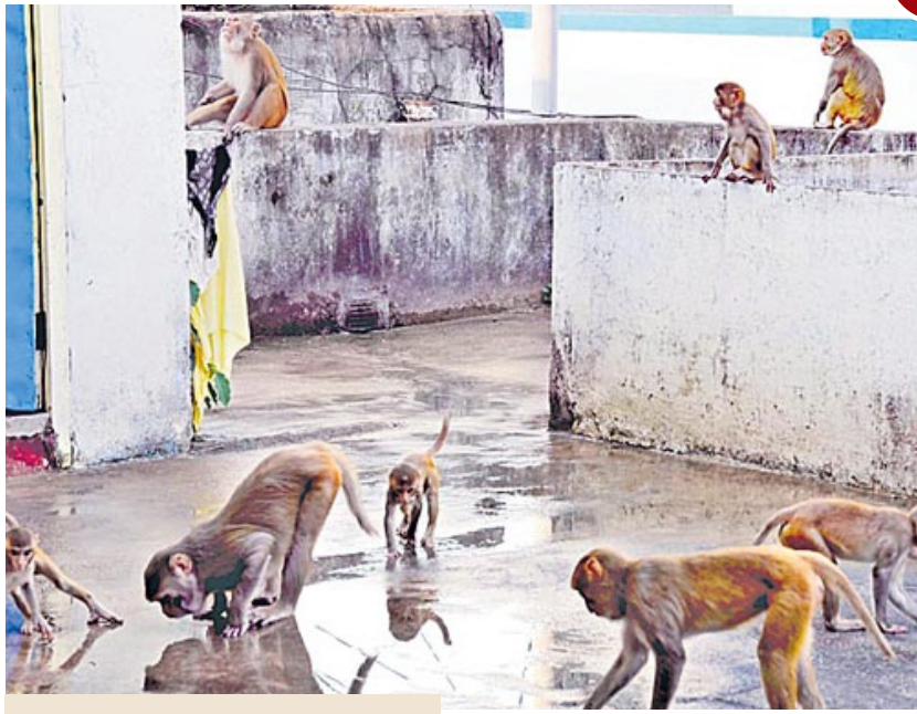
కొత్త పాలక మండలి దృష్టి సారించాలి :

కోతుల బెడదపై మున్సిపల్ పాలక మండలి దృష్టి సారించాలి, వాటిని నియంత్రించి ప్రజలు స్వేచ్ఛగా రోడ్లపై తిరిగేలా చేయాలని కోరుతున్నాం.