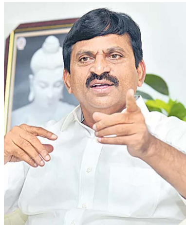
జయభేరి, హైదరాబాద్, మార్చి 31 :