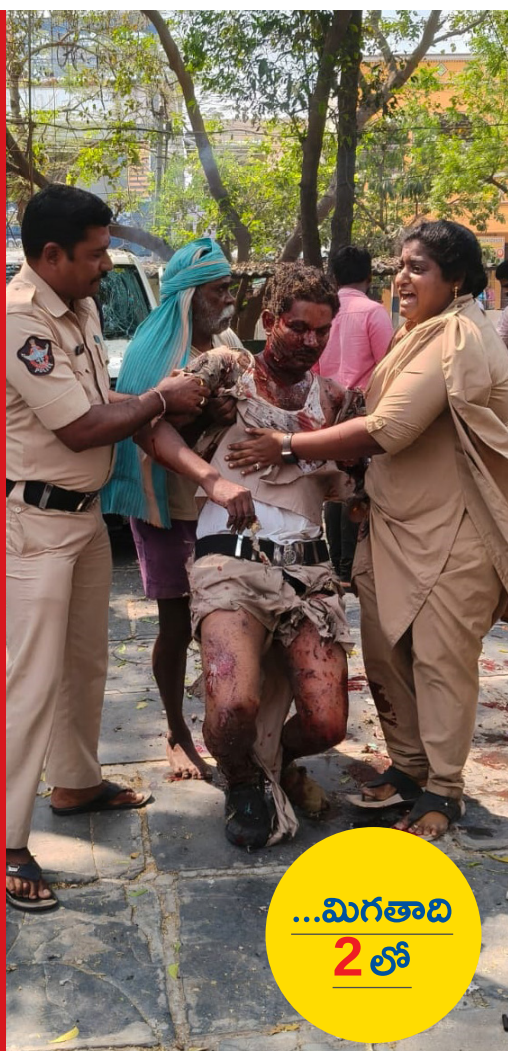
...మిగతాది 2 లో