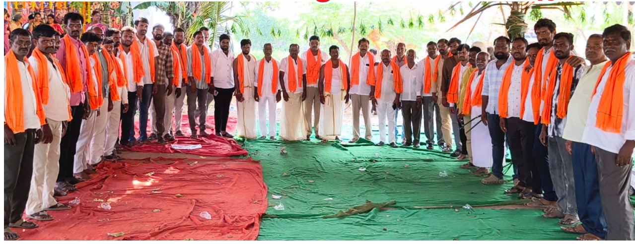
పెద్దలు ఏర్పాటు చేశారు. ఈ సందర్భంగా గ్రామస్థులు మాట్లాడుతూ....

నాగులపల్లి గ్రామంలో ఘనంగా శ్రీ సీతారాముల కల్యాణ మహోత్సవ కార్యక్రమం గ్రామ పెద్దలు, సర్పంచ్, ఉప సర్పంచ్, వార్డు సభ్యులు, మాజీ సర్పంచ్ లు, మాజీ ఉప సర్పంచ్ లు, మాజీ వార్డు సభ్యులు, మహిళలు, యువకులు, అందరి సమక్షంలో ఘనంగా నిర్వహించారు. రంగారెడ్డి జిల్లా షాద్ నగర్ నియోజకవర్గం ఫరూక్ నగర్ మండలం నాగులపల్లి గ్రామంలో శుక్రవారం ఏర్పాటుచేసిన సీతారాముల కల్యాణం భారీ సంఖ్యలో గ్రామస్థులందరూ పాల్గొని కార్యక్రమాలను ఘనవిజయం చేశారు. సీతారాముల కల్యాణానికి చచ్చిన భక్తులకు మందిరీను, భజనం వంటి సౌకర్యాలను గ్రామ