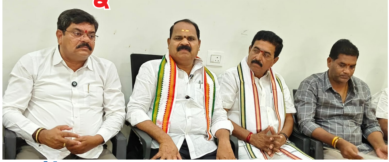
గత బిఆర్ఎస్ ప్రభుత్వం ధనిక రాష్ట్రాన్ని దరిద్రంగా మార్చింది

గత బిఆర్ఎస్ ప్రభుత్వం చేయని అభివృద్ధి పనులను కాంగ్రెస్ ప్రభుత్వం చాలా చిత్తశుద్ధితో నాన్వో ప్రమాణాలతో అన్ని పనులను పూర్తి చేస్తుంది అన్నారు. ప్రతిపక్షం తన హోదాను మరచిపోయి అసహనం ప్రకటించి వ్యూహాలు చేస్తుందని మండిపడ్డారు. సీఎం రేవంత్ రెడ్డి ఏర్పాటు చేస్తున్న అన్ని పనులను తీసుకువచ్చా రని అన్నారు. నాణ్యత ప్రమాణాలు పాటిస్తూ విద్య, వైద్యం ప్రతి సామాన్యుడికి అందుతుందని అన్నారు.