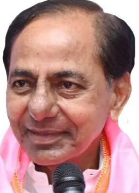
కేసీఆర్ తెలంగాణ రాష్ట్ర ఏర్పాటులో కీలక పాత్ర పోషించారు. ఈ భావోద్వేగ కారణం ఇప్పటికీ ప్రజల మనసుల్లో బలంగా నాటుకుంది. ...మిగతాది 2 లో

తెలంగాణలో కాంగ్రెస్ అధికారంలోకి వచ్చి ఏడాదిన్నర దాటింది. సీఎంగా రేవంత్ రెడ్డి పాలన తొలి ఏడాది వరకు బాగానే సాగినట్లు అనిపించింది. కానీ, ఇప్పుడు పెద్దగా సులభమే చేసినట్లు కనిపించడం లేదు. పథకాలు ముందుకు సాగడం లేదు. హామీలు అమలు కావడం లేదు. ఈ భావన ప్రజల్లో కనిపిస్తోంది. ఈ తరుణంలో మూడ్ ఆఫ్ ది పీపుల్ అండ్ పబ్లిక్ సంస్థ నిర్వహించిన తాజా సర్వేలో సంచలన నిజాలు వెల్లడయ్యాయి. ఈ సర్వేలో సీఎం పాలన బాగుందని అడిగిన ప్రశ్నకు మెజారిటీ ప్రజలు కేసీఆర్ కి ఓటు వేశారు. సర్వేలో ప్రజలు కేసీఆర్ పాలనకు 55.68% మద్దతు ఇవ్వగా, రేవంత్ రెడ్డికి 28.40% మాత్రమే మద్దతు లభించింది. కేసీఆర్ నాయకత్వంలో భారత రాష్ట్ర సమితి (బీఆర్ఎస్) పాలన తెలంగాణ రాష్ట్ర ఆవిర్భావం నుంచి రాష్ట్ర అభివృద్ధికి గణనీయమైన కృషి చేసిందని చాలా మంది భావిస్తున్నారు. అందుకే సర్వేలో 55.68% మంది కేసీఆర్ కు మద్దతు ఇచ్చారని తెలుస్తోంది. ...మిగతాది 2 లో